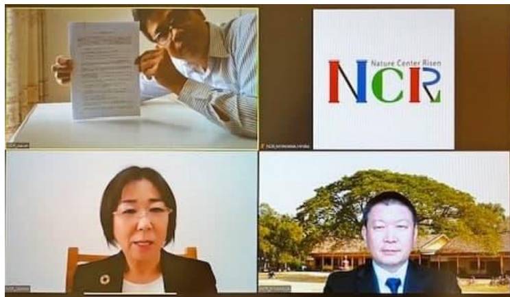
（特活）Nature Center Risen 現地職員による署名の様子

（特活）Nature Center Risenは、2013年からカンボジアにおいて、学校教育を通して環境に対する若年層の意識の向上を図る活動に取り組まれてきました。本事業では、市民の環境リテラシー向上に資する教材の開発、日本人講師による寺院やヘルスセンターと連携した環境教育研修といった活動を通して、カンボジアの市民に対して環境意識を啓発する活動を実施されます。本事業を通じ、全世代の国民が環