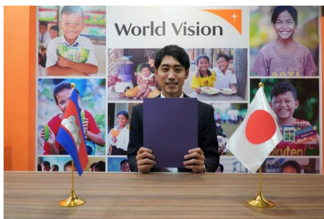
（特活）ワールド・ビジョン・ジャパン 現地事業責任者による署名の様子

（特活）ワールド・ビジョン・ジャパンは、これまでカンボジア各州において地域開発を通じた保健衛生、教育及び収入向上に関する活動に取り組まれてきました。事業2年次である本年次においては、保健職員及び村落保健支援グループへの母子保健に関するトレーニング、母親支援グループへの母親と乳幼児の栄養に関するトレーニング及び給水システムの整備に取り組まれる他、コミュニティ保健栄養基金の設立や地域清掃キャンペーンを新たに実施される予定です。本事業を通じて、子どもたちの健康・栄養状態が改善し、地域住民の皆様が安全な水を利用できることが改善されることが期待されます。