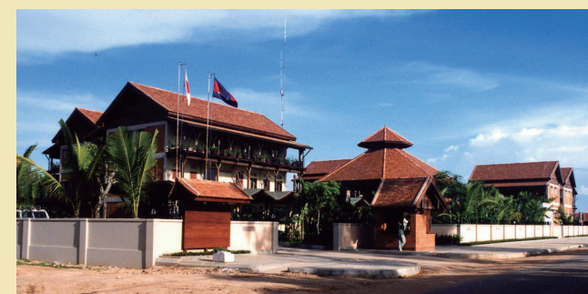
UNESCO/JASA プロジェクト・オフィス バイヨン・インフォメーション・センター