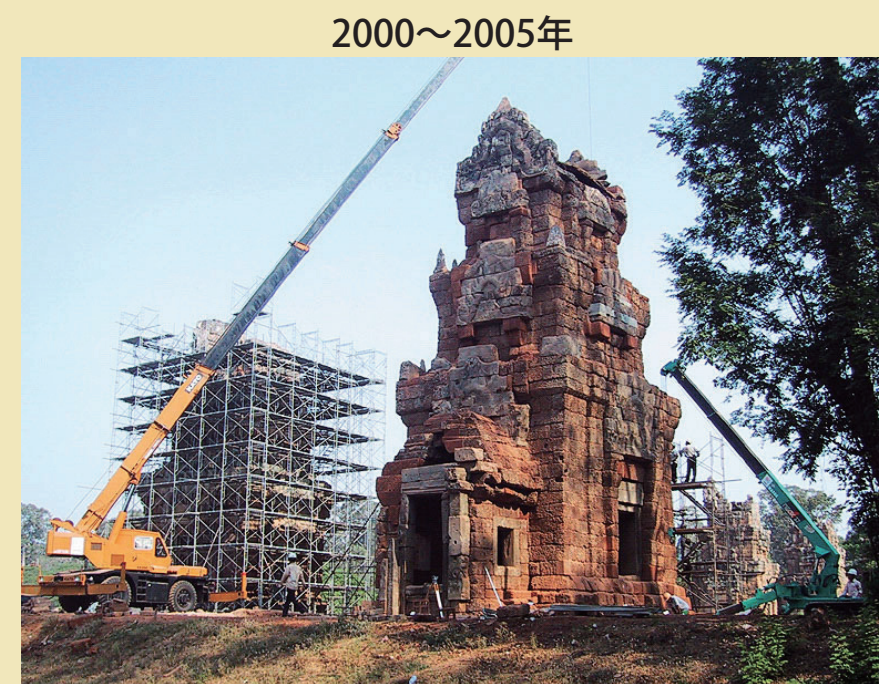
2000～2005年 修復事業 プラサート・スー・プラ N1/N2 塔