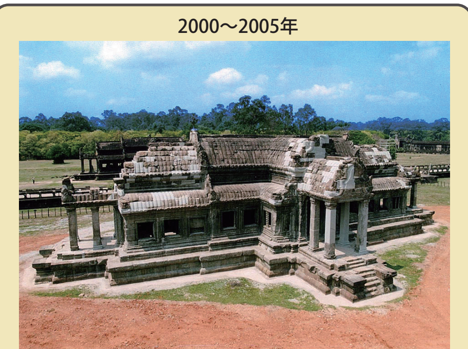
2000～2005年 修復事業 アンコールワット寺院 北経蔵