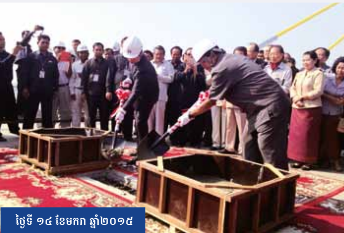
ថ្ងៃទី ១៤ ខែមករា ឆ្នាំ២០១៥