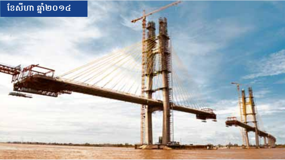
ខែសីហា ឆ្នាំ២០១៤