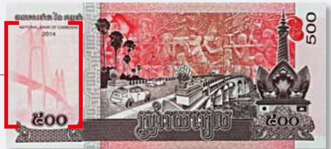
ក្រដាសប្រាក់ ៥០០ រៀលថ្មី ដែលមានរចនារូបស្ពានស្ទឹងតាសា

ពិធីចាក់បេតុងតភ្ជាប់ស្ពាន ស្ទឹងតាសា ក្រោមអធិបតីភាពដ៏ខ្ពង់ខ្ពស់របស់ សម្តេចអគ្គមហាសេនាបតីតេជោ ហ៊ុន សែន នាយករដ្ឋមន្ត្រីនៃព្រះរាជាណាចក្រកម្ពុជា