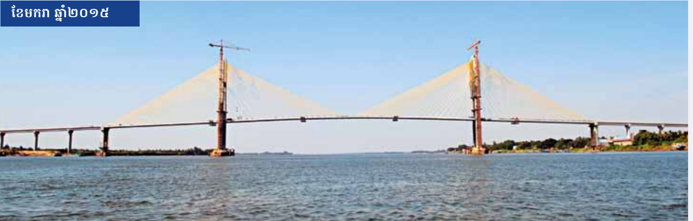
ខែមករា ឆ្នាំ២០១៥