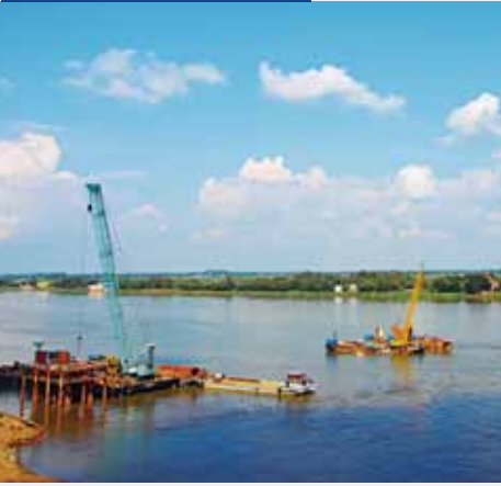
ខែធ្នូ ឆ្នាំ២០១២