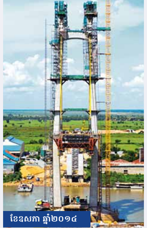
ខែឧសភា ឆ្នាំ២០១៤