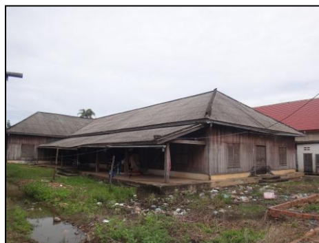
▲本案件で改修する感染症病棟

本案件では、コンポントム州病院敷地内の感染症病棟の改修及び器材を設置することで、現在同病院で深刻な問題となっている院内感染の改善を図ります。本案件実施により、約66万人の地域住民らが裨益すると見込まれます。